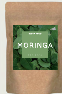
ティーパックタイプ 10 パック入